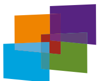
Insertion directe de documents dans les annexes du dossier de révision.