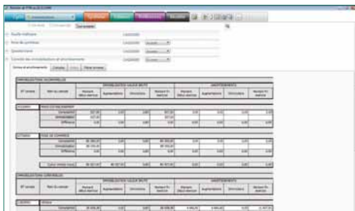
Encapsulation d'un classeur Excel dans Open Révision.