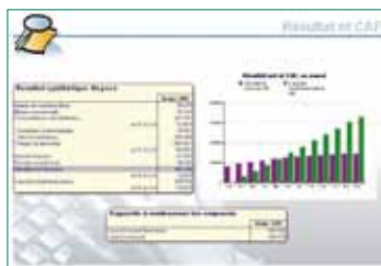
Exemple de diaporama pour présenter le budget d'une PME