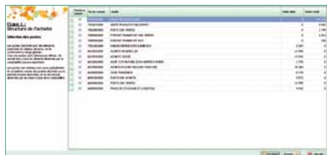
L'assistant à la création du dossier personnalisé