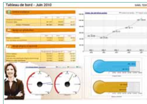
Exemple de diaporama présentant le tableau de bord d'une TPE