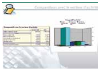
Exemple de diaporama avec une comparaison du secteur d'activité